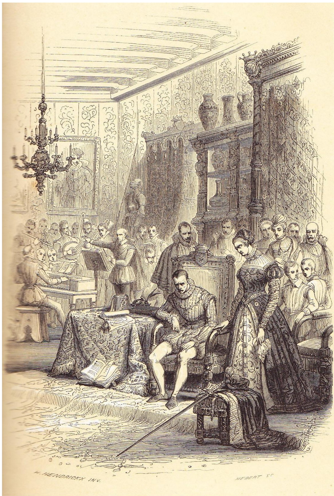
Orland de Lassus faisant exécuter en présence de Charles IX les Psaumes de la pénitence.